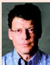
Laurent Alexandre Chirurgien et Essayiste