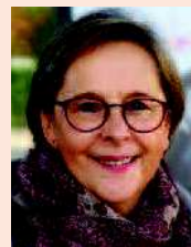
Annie Vidal Députée de Seine-Maritime