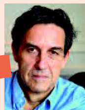
Emmanuel Todd Philosophe et Démographe