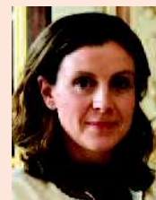
Charlotte Lecocq Députée du Nord