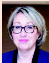
Marie-Anne Montchamp Présidente de la CNSA