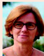
Agnès Firmin Le Bodo Députée de Seine-Maritime