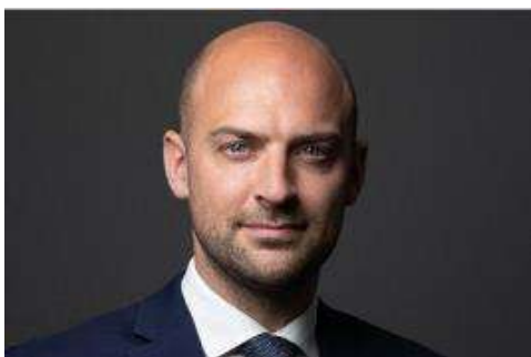
JEAN-NOËL BARROT Ministre délégué chargé de la Transition numérique et des Télécommunications

« Alors que l'enjeu de nourrir sainement et durablement le monde est encore devant nous, le monde agricole fait face à une nécessaire transition.